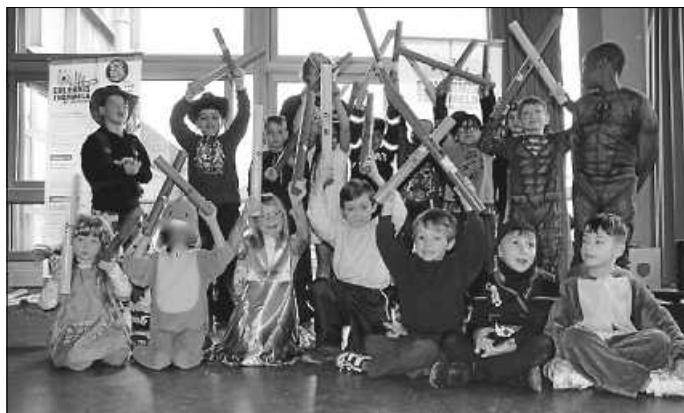
Schüler mit Boomwhacker