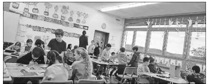
Spannende Aufgaben an verschiedenen Stationen.

Die Unterrichtseinheiten waren für die gesamte Klasse eine wertvolle Ergänzung zum aktuellen Thema Strom. Durch anschauliche Experimente, spannende Erkenntnisse und die direkte Verbindung zum Alltag wurde das Bewusstsein für Energieeinsparung und Klimaschutz gestärkt. Nun sind die Schülerinnen und Schüler bestens gerüstet, um bewusster mit Energie umzugehen und ihr Wissen auch im eigenen Zuhause anzuwenden. Wir freuen uns bereits auf die nächste Unterrichtseinheit. SÜ