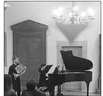
JuMu Duo Klavier und Horn

Büro der Musik- und Kunstschule , Kulturhalle Remchingen, Tel.: 07232-71088, info@mswe.de; www.mswe.de. Öffnungszeiten: Mo. – Mi. und Fr. 9.00 – 12.00 Uhr und Do. 9.00 – 14.00 Uhr (außer in den Schulferien).