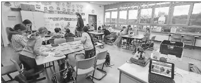
Die Schülerinnen und Schüler bei den Versuchen.

Die Schülerinnen und Schüler arbeiteten in fünf Gruppen, die sich jeweils mit einem bestimmten Aspekt des Themas beschäftigten und dazu verschiedene Versuche durchführten.